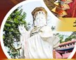
เจ้าแม่กวนอิมรพีลส์เบย์