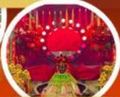
เจ้าแม่กวนอิมช่องซ่า