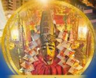
วัดหลินฟา