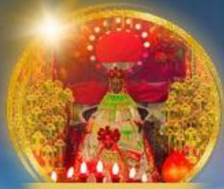
เจ้าแม่กวนอิมฮ่องซ่า