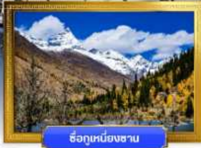
ชื่อภูเขาหิมะชาน