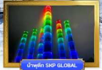
น้ำพุตึก SKP GLOBAL