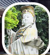
เจ้าแม่กวนอิม รัชส์ เบย์