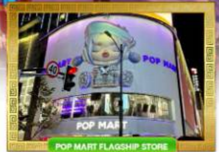
POP MART FLAGSHIP STORE