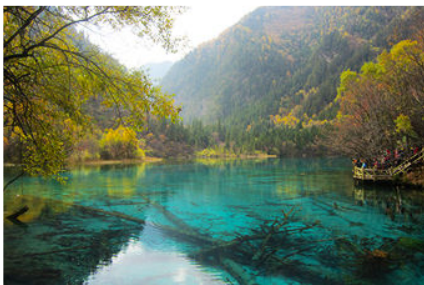
อุทยานจิวจ้าวโกว

พักที่ MINJIANG HAOTING HOTEL 4* หรือระดับ 4 ดาว พื้นเมือง