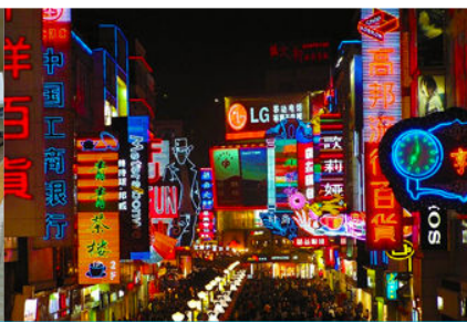
ถนนคนเดินชุนชี่ลู่