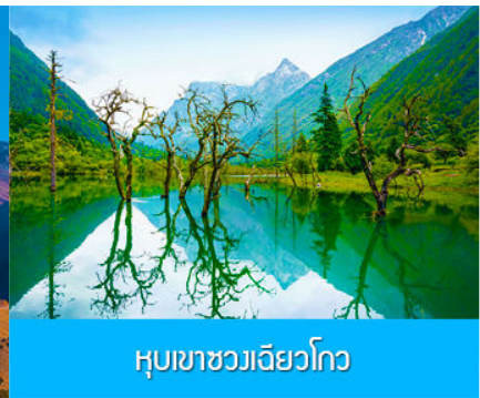
หุบเขาชวงเฉียวโกว