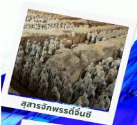
สุสารจักรพรรดิจีนซี