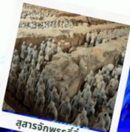
สุสานจักรพรรดิจีนซี