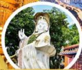
เจ้าแม่ทวนอิม รัฟลั เบย์