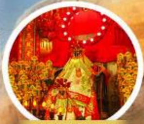
เจ้าแม่ทวนอิมช้องจ๋า