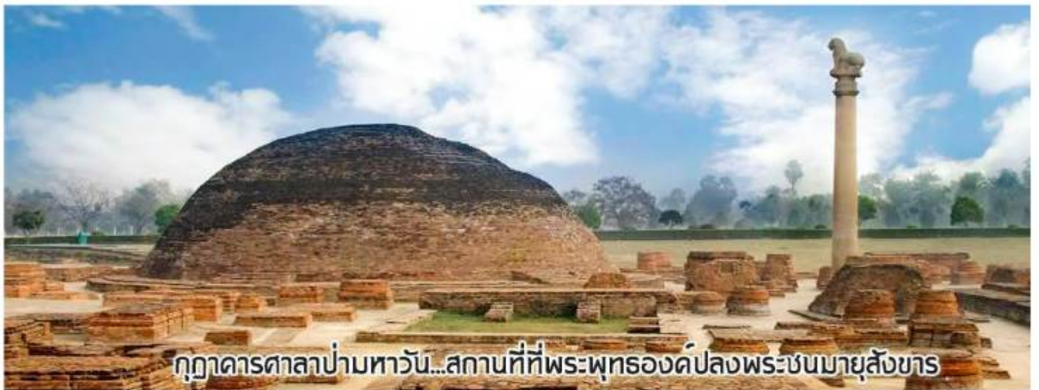
กุฎาคารศาลาปามหาวัน...สถานที่ที่พระพุทธองค์ปลงพระชนมายุสังขาร

บ่าย นำคณะเดินทางสู่ เมืองไวสาลี เมืองหลวงของอาณาจักรวัชชี หนึ่งใน 16 แคว้นของชมพูทวีป เรียกกันหลายชื่อว่า ไวสาลี ไผสาลี หรือ เวสาลี ก็ได้ ในสมัยพุทธกาลเคยเป็นศูนย์กลางการเผยแผ่พระพุทธศาสนาที่สำคัญยิ่งอีกแห่งหนึ่ง สถานที่ที่พระพุทธองค์ปลงพระชนมายุสังขารใช้เวลาเดินทางราว 4 ชม. เข้านมัสการ กุฎาคารศาลาปามหาวัน เป็นสถานที่ที่กำเนิดภิกษุณีรูปแรก เป็นที่ที่ให้นามนตเป็นครั้งแรก ที่นี่ยังมีเสาโศกที่สมบูรณ์ที่สุดในประเทศอินเดีย