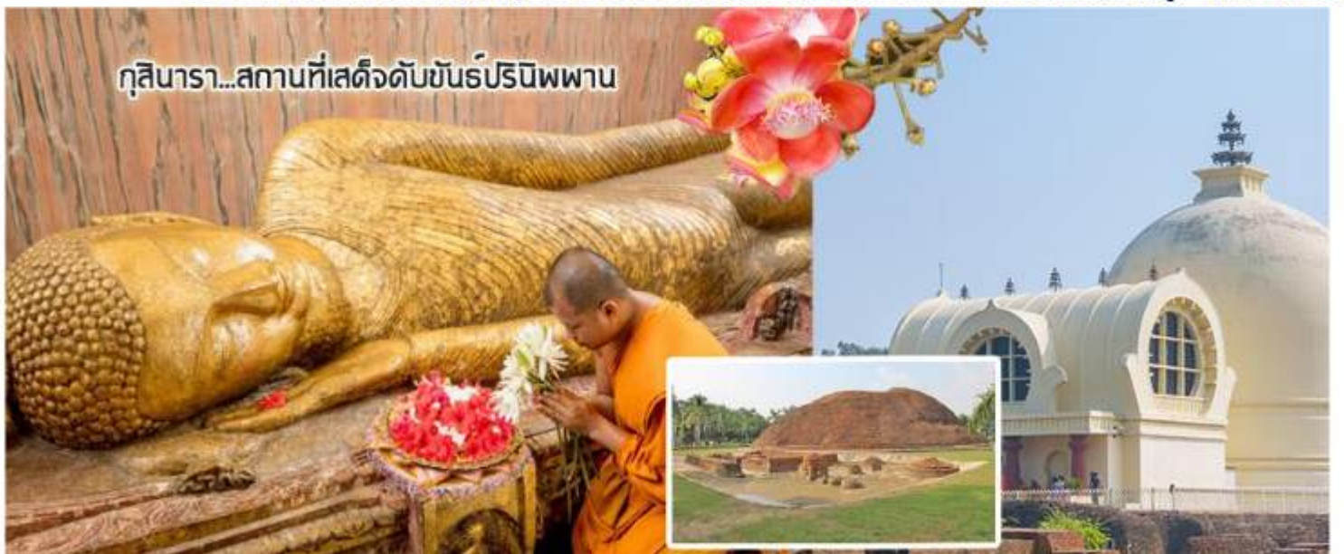
กุสินารา...สถานที่เสด็จดับขันธปรีณิพพาน

ร่วมกันทำสมาธิภาวนา แล้วนำท่านไป นมัสการมกุฏพันธเจดีย์ (Makutabandana)