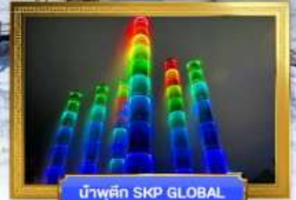
น้ำพุสี SKP GLOBAL