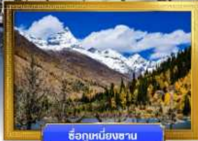
ชื่อภูเขาหิมะชาน