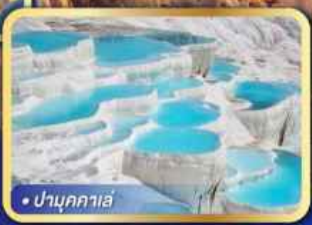
• ปามุกคาเล่