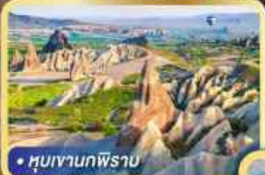
• หุบเขานกฟิรา