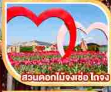
สวนดอกไม้จางเซ่อ ไถจง