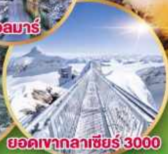
ยอดเขากลาเซียร์ 3000