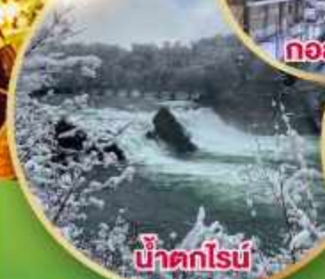
น้ำตกโรน