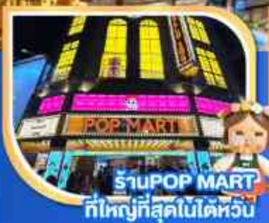
ร้าน POP MART ที่ใหญ่ที่สุดในโลกไต้หวัน