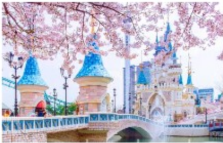
สวนสนุกแห่งนี้

หมู่บ้านบุกซอนฮันอก หมู่บ้านโบราณตั้งแต่สมัยราชวงศ์โชซอน ที่ยังคงสถาปัตยกรรมแบบดั้งเดิม มองไปทางไหนก็เจอแต่บ้านทรงโบราณเหมือนที่เราเห็นในซีรีส์ ทำให้มีนักท่องเที่ยวและวัยรุ่นเกาหลีชอบเช่าชุดฮันบกมาถ่ายรูปที่นี่ จุดถ่ายรูปยอดฮิตในหมู่บ้านก็คือบริเวณเนินที่มองเห็นหอคอยโซลทาวเวอร์ รวมถึงยังมีบางส่วนที่เปิดเป็นร้านอาหาร คาเฟ่ และเกสต์เฮาส์อีกด้วย