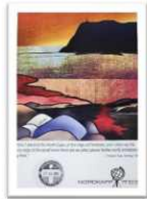
North cape Certificate

• เมืองอัลตา (Alta) ตั้งอยู่ทางเหนือของนอร์เวย์ ห่างจาก Arctic Circle ราว 375 กิโลเมตร ทำให้ที่นี่มีอากาศหนาวเย็นสุดขั้วในช่วงฤดูหนาว แต่ก็มีอากาศที่อบอุ่นขึ้นมาน้อยในช่วงฤดูร้อน นอกจากการชมแสงเหนือในยามค่ำคืนแล้ว ที่นี่ยังมีงานเทศกาล Finnmarkslopet ซึ่งเป็นการแข่งขันรถลากเลื่อนสุนัขชื่อดังของยุโรปที่จะจัดขึ้นในทุกๆ ปี