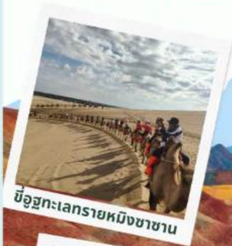
ขี่อูฐทะเลทรายหมิงซาซาน