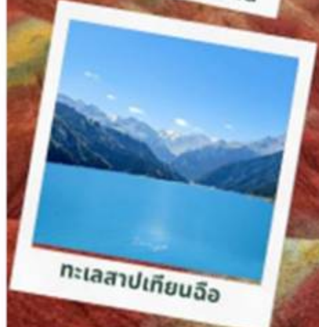
ทะเลสาบเทียนฉือ