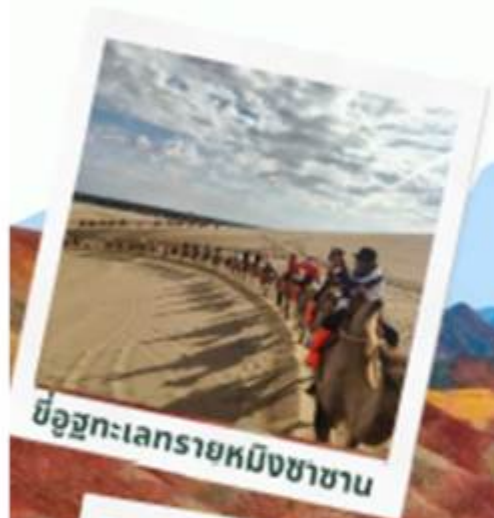
ขบวนคาราวานอูฐ