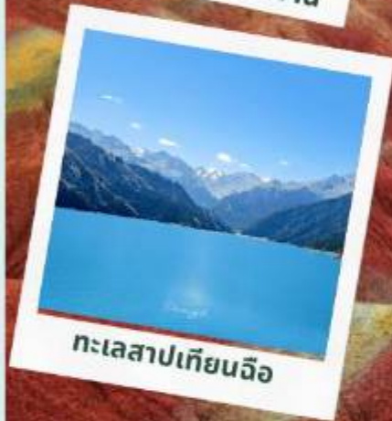
ทะเลสาบเทียนฉือ