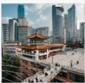
ตึกหุบซิง (ตึก 22 ชั้น)