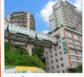
นั่งรถไฟทะลุตึก