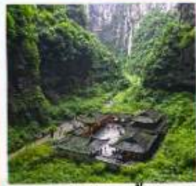
อุทยานหลุมฟ้า สะพานสวรรค์