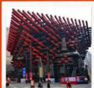
พิพิธภัณฑ์ศิลปะจางซี