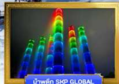
น้ำพุตก SKP GLOBAL