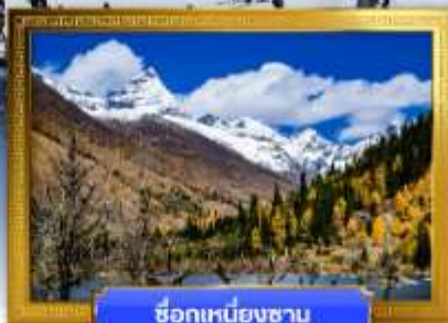
ชื่อภูเขาหิมะชาน