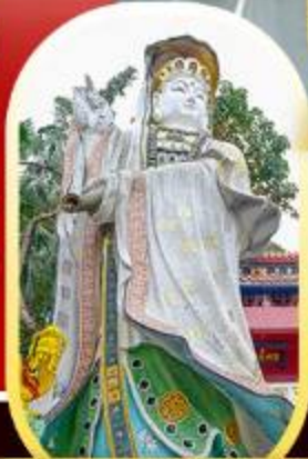
วัดเจ้าแม่กวนอิมรี พลัสเบย์