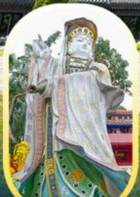
วัดเจ้าแม่กวนอิมรี พลัสเบย์