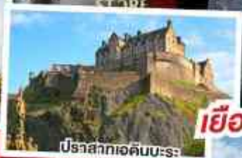
ปราสาทเอดินบะระ