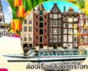
ล่องเรือหลังคานระจก