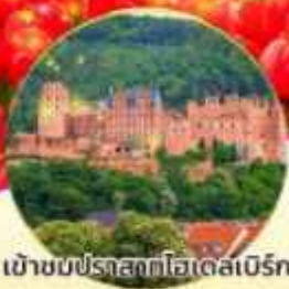
เข้าชมปราสาทไอเดลเบิร์ก