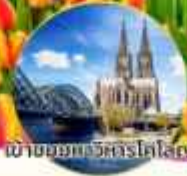
เข้าชมมหาวิหารโคโลญ