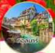
คลองเบอร์