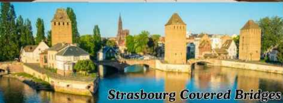
Strasbourg Covered Bridges

นำท่านเดินทางสู่เมือง สตราซบูร์ก นำท่านถ่ายรูปกับ Strasbourg Covered Bridges เป็นกลุ่มสะพานเก่าแก่ตั้งอยู่บริเวณเขตประวัติศาสตร์ La Petite France ริมน้ำอิล (Ill River) สะพานเหล่านี้สร้างขึ้นครั้งแรกในศตวรรษที่ 13 โดยมีหลังคาคลุมเพื่อป้องกันทหารและประชาชนจากสภาพอากาศเมื่อมีการป้องกันเมือง ปัจจุบันแม้ว่าหลังคาดั้งเดิมจะถูกถอดออกไปแล้ว แต่ชื่อ "สะพานมีหลังคา" ยังคงถูกใช้สืบมาจนถึงปัจจุบัน