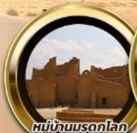
หมู่บ้านมรดกโลก ดิริยะฮ์ Al Diriyah

บินหรู อยู่สบาย เที่ยวบินดี ซิลด์ ซิลด์ 10 ท่าน คอมพิวเตอร์เดินทาง