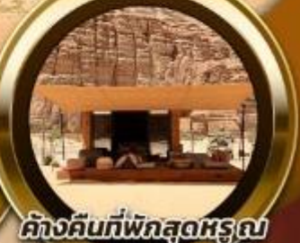
ค้ำคืนที่พักสุดหรู Habitat AlUla 2 คืน

พิเศษ!! รับประทานอาหาร ณ ภัตตาคารอาหารไทย สุดหรูและไฮโซ @Saffron Banyan Tree AlUla