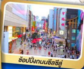
ช้อปปิ้งถนนซิลิซู่