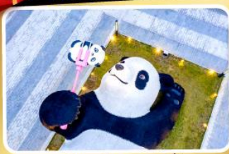
หมีแพนด้าอนเซลฟี