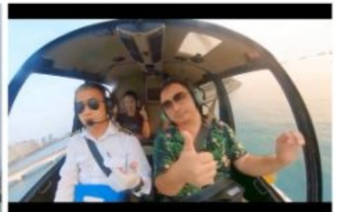
ดั่งภาพฝัน (รวมค่าขึ้นเฮลิคอปเตอร์)

หมายเหตุ*** ใช้เวลาในการนั่ง โดยสาร ประมาณ 1 นาทีต่อรอบ และจำกัดผู้โดยสารครั้งละไม่เกิน 3 ท่าน โดยที่มีน้ำหนักรวมทั้งหมดไม่เกิน 200 กก.