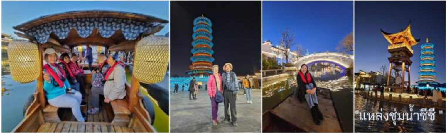
"แหล่งชมน้ำซีซี"

แหล่งชมน้ำแห่งนี้ เป็นดั่งเช่นแหล่งอนุรักษ์สัตว์ปีก สัตว์น้ำตามธรรมชาติ มีอาณาเขตที่กว้างขวางมาก มีความสวยงามในทุกฤดูกาล โดยเฉพาะฤดูใบไม้ร่วง เป็นช่วงที่ดอกอ้อสีขาวบานเต็มสองฝั่งน้ำทั้งเจ็ดสายที่มีอยู่ในแหล่งชมน้ำแห่งนี้ มีการจัดเทศกาลดอกอ้อบานในทุกปีของเดือนพฤศจิกายนอีกด้วย ความสวยงามของแหล่งชมน้ำซีซีแห่งนี้ ได้ถูกพรรณนาผ่านบทกลอนมากมายในสมัยราชวงศ์ซิง โดยนักกวีจะส่งเรือผ่านสายน้ำแล้วจะร้ายบทกลอน ชมดอกอ้อ ชมสายน้ำที่ใสสะอาด และความงามของใบไม้ในช่วงฤดูใบไม้ร่วง