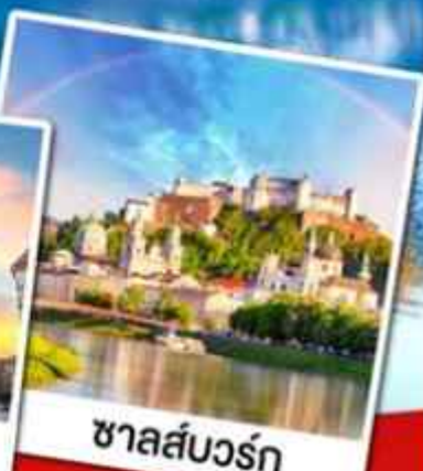
ชาลส์บวร์ก