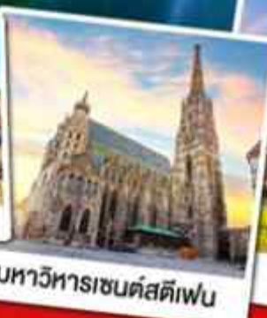
มหาวิหารซนต์สตีเฟน