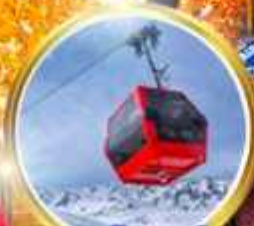
กระเช้ากุลมาร์ค ชมวิวสุดอลังการ