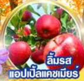
ลิ้มรส แอปเปิ้ลแคชเมียร์