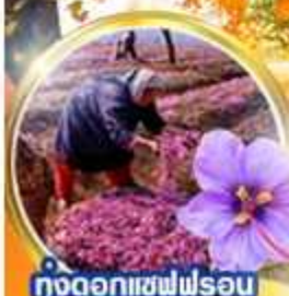
ทุ่งดอกเซฟฟรอน