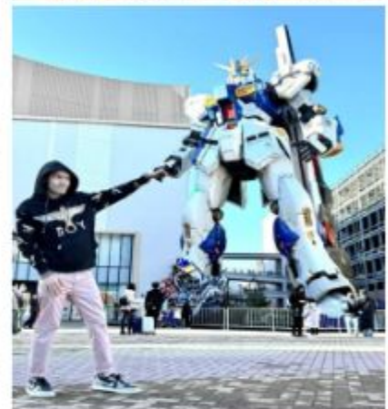
หุ่นกันดั้ม ชื่อ RX93 FF No Gundam

🎯 รับประทานอาหารกลางวัน ณ ภัตตาคาร เดินทางต่อไปยัง ร้านค้า DUTY FREE ให้ท่านได้ช้อปปิ้งสินค้าปลอดภาษีที่มีคุณภาพ อาทิ เครื่องสำอาง โฟมล้างหน้า(แนะนำ) อาหารเสริม ขนม เครื่องใช้ต่างๆ ฯลฯ ...จากนั้นแวะ แซะรูปกับหุ่นกันดั้มยักษ์ ณ ห้าง LaLaport (หากมีเวลาพอ) มีขนาดใหญ่กว่า Unicorn Gundam ที่โตเกียวและใหญ่กว่า RX93 FF Gundam ที่ Gundam Factory Yokohama เรียกได้ว่าเป็นแลนด์มาร์คสำคัญของเมืองฟูกุโอกะในปัจจุบัน ...จากนั้นอิสระให้ท่านช้อปปิ้ง ย่านเท็นจิน (Tenjin) หรือ ย่านฮากาตะ (Hakata) เป็นย่านช้อปปิ้งขนาดใหญ่ใจกลางเมือง รวบรวมแหล่งบันเทิง อย่างครบครัน ไม่ว่าจะเป็นตึกต้นไม้ ร้านค้าที่น่าสนใจ และบรรยากาศสุดคลาสสิก หรือจะเป็นย่านของกินอร่อยๆ อย่างย่านยะไต (Yatai) หมายถึง ชุมชายอาหารที่มีขนาดไม่ใหญ่มาก ที่รวมร้านอาหารแบบฉบับท้องถิ่นเอาไว้มากมาย