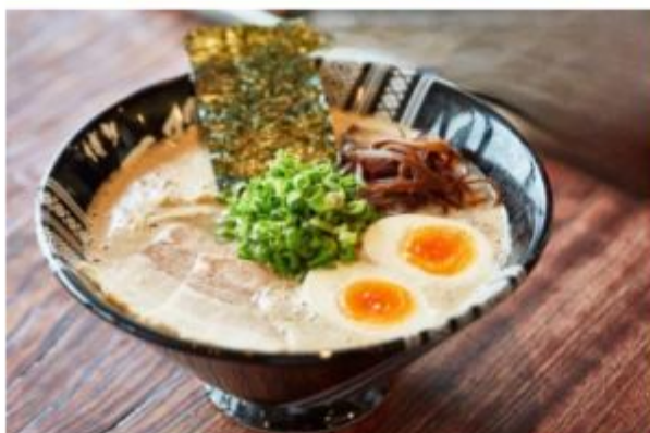
ฮากาตะราเม็ง (Hakata Ramen)