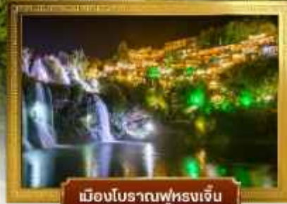
เมืองโบราณฟุ่หลงเจิน