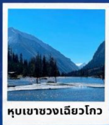
หุบเขาขวงเจียวโกว