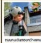
ถนนคนเดินฮูเป่ย์