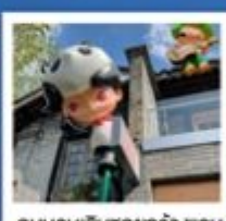
ถนนคนเดินซอยกว้างแอกน