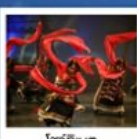
โซ่วทึเบต