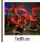
โถงโพธิ์