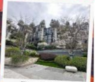
Tian An 1,000 Trees Square