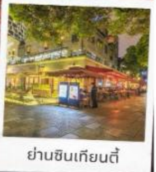
ย่านซินเทียนตี้