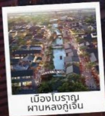
เมืองโบราณ ผานหลงกุ่เจิน