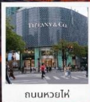
ถนนหวยไห้