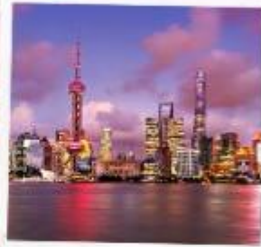
ชั้นหอไข่มุก