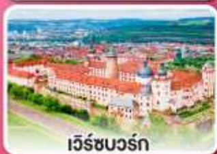
เว็ร์ชบวร์ค