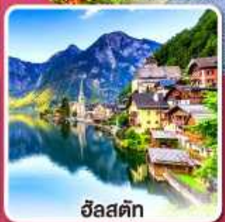
ฮิลส์ติก