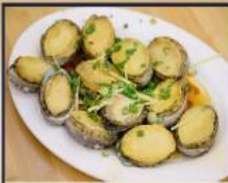
เป่าฮื้อสดนึ่ง