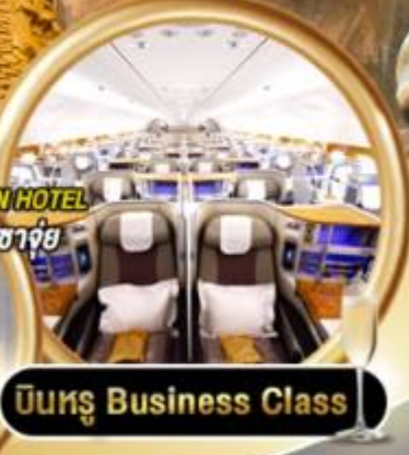
บินหรู Business Class