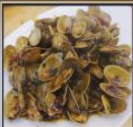
ผัดหอยลาย