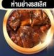
ทำอย่างรสนิยม