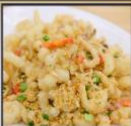
หมึกทอดกระเทียม