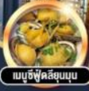
เมนูซีฟู้ดลิ้นจี่อบ