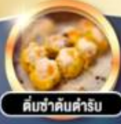
คืนชาคืนตำรับ

การันตี!! พักหรู 4 ดาว THE KOWLOON HOTEL ติดถนนบาราน ย่านช้อปปิ้งจิมซาจอย