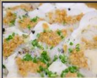
หอยเชลล์อบวุ้นเส้น