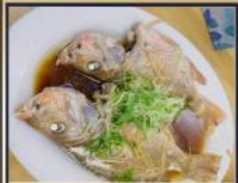
ปลาหนังซีอิ๊ว