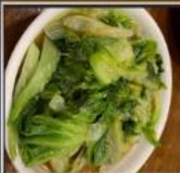
ผัดผักตามฤดูกาล