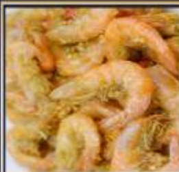
กุ้งทอดกระเทียม