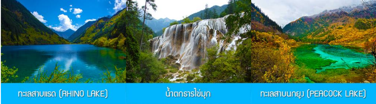
ทะเลสาบแรด (RHINO LAKE)

หลังอาหารเช้านำท่านเดินทางสู่ อุทยานแห่งชาติจิวจี้โกว (JIUZHAIYOU NATIONAL PARK) ตั้งอยู่ด้านทิศเหนือของมณฑลเสฉวน ซึ่งเป็นส่วนหนึ่งในบริเวณตอนใต้ของเทือกเขาหิมิงซาน ห่างออกไปจากตัวเมืองเฉิงตูราว 500 กิโลเมตร จิวจี้โกวมีชื่อเสียงด้านความงามแห่งสีสันที่แปลกเปลี่ยนไม่รู้จบ ทะเลสาบผุดขึ้นท่ามกลางหมู่แมกไม้เขียวขจี น้ำใสเป็นประกายชุ่มฉ่ำ ยอดเขาหิมะตัดกับท้องฟ้าสีคราม เกิดเป็นภาพธรรมชาติอันงดงามที่แปรเปลี่ยนไปตามฤดูกาลผลิ ด้วยความสวยงามจึงทำให้อุทยานแห่งชาติจิวจี้โกว ได้ถูกขึ้นทะเบียนเป็นมรดกโลกทางธรรมชาติ ในปีค.ศ. 1992