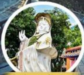
เจ้าแม่กวนอิม รัชลีส เบย์