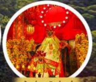
เจ้าแม่กวนอิมอ่องซ่า