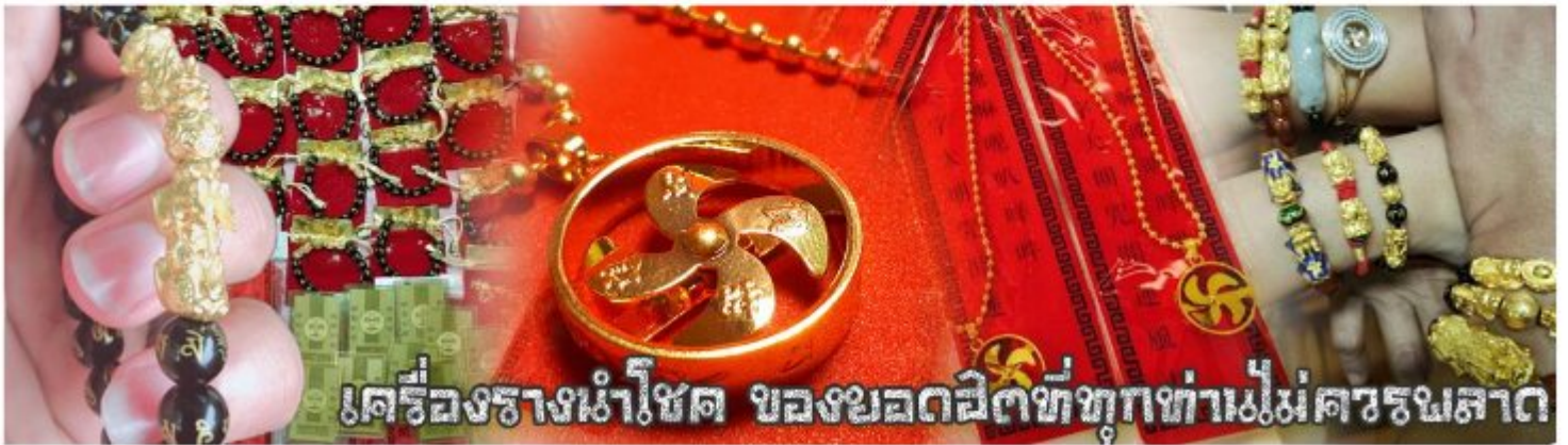
เครื่องรางนำโชค ของขลังผลิตขึ้นทุกท่านไม่ควรรณลาด

เครื่องรางที่นิยมสวมใส่อยู่ในปัจจุบัน ซึ่งบางท่านอาจจะกำลังมองหาเพื่อนำมาเป็นของฝากให้กับบุคคลที่ท่านรักหรือนับถือ หรือท่านที่กำลังมองหางานของขวัญดีๆ สักชิ้นเพื่อเสริมดวง แถ่ปีชง ปิดเป่าสิ่งชั่วร้าย เรามิบริการแนะนำ อีกมากมาย หลากหลายรายการ ซึ่งหัวหน้าทัวร์และไกด์ท้องถิ่นจะคอยอำนวยความสะดวกในการให้รายละเอียดกับคุณลูกค้า ณ วันเดินทาง