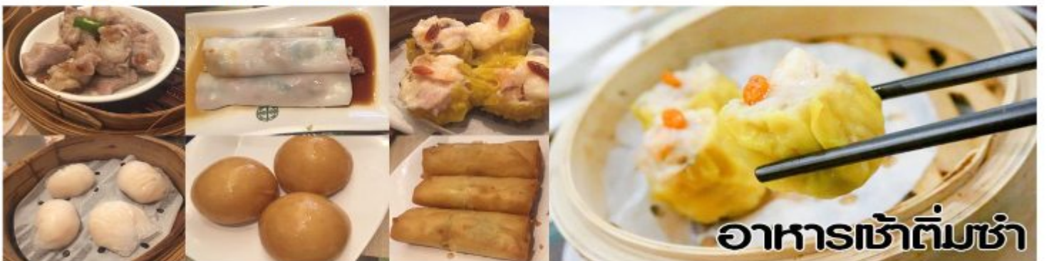
อาหารเช้าติ่มซ่า