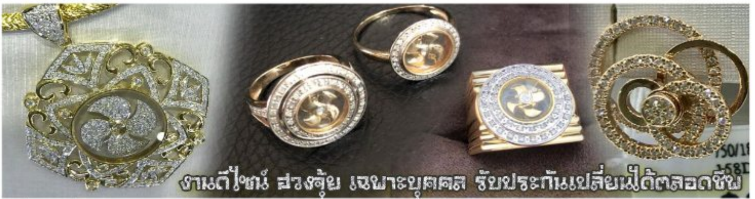
งามดีเ็นทร์ สวยจุ้ย เฉพาะบุคคล รับประกันเปลี่ยนเมื่อตกลงชื้อ

เครื่องรางที่นิยมสวมใส่อยู่ในปัจจุบัน ซึ่งบางท่านอาจจะกำลังมองหาเพื่อนำมาเป็นของฝากให้กับบุคคลที่ท่านรักหรือนับถือ หรือท่านที่กำลังมองหางานของขวัญดีๆ สักชิ้นเพื่อเสริมดวง แถ่ปีชง ปิดเป่าสิ่งชั่วร้าย เรามิบริการแนะนำ อีกมากมาย หลากหลายรายการ ซึ่งหัวหน้าทัวร์และไกด์ท้องถิ่นจะคอยอำนวยความสะดวกในการให้รายละเอียดกับคุณลูกค้า ณ วันเดินทาง