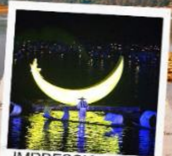
IMPRESSION LIU SANJIE