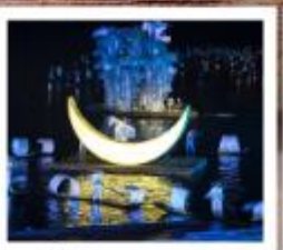
โชว์หลิวซานเจีย