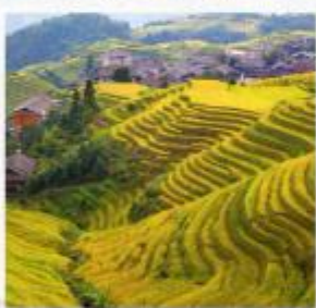
นาขั้นบันไดหลงจี้