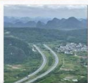
เขาหลุยี่