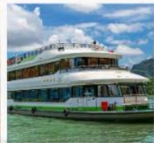
ล่องเรือแม่น้ำ หลี่เจียง