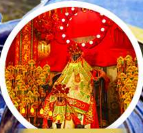
เจ้าแม่กวนอิมอ่องฮ่า