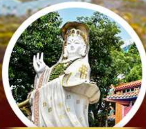
เจ้าแม่กวนอิม รัชกาลที่ ๖