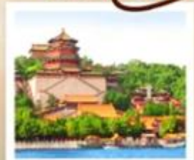
อวิ๋นโหลหยวน