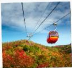
กำแพงเมืองจีน ด้านมู่เทียนยวี