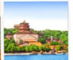
พระราชวังฤดูร้อน อวิเหอหยวน