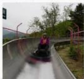
ลงสไลด์เดอร์, ด้านมู่เทียนยวี