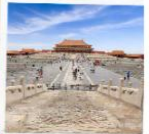
พระราชวังกุ๊กก