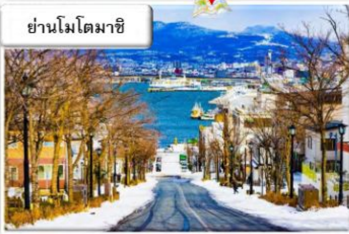
ย่านโมโตมาชิ

ย่านเมืองเก่าโมโตมาชิ (Motomachi District) หรือมีชื่อเรียกอีกอย่างว่า ท่าเรือเมืองฮาโกดาเตะ ตั้งอยู่ที่เมืองฮาโกดาเตะ (Hakodate) ภายในจังหวัดฮอกไกโด (Hokkaido) ย่านนี้นับเป็นย่านที่มีประวัติยาวนานเป็นร้อยปี แลมสิ่งปลูกสร้างต่างๆก็ยังคงมีการอนุรักษ์ไว้อย่างดีเยี่ยม แม้ภายหลังจะมีบ้างแห่งที่มีการปรับเปลี่ยนเป็นอย่างอื่นบ้าง หากด้านนอกก็ยังคงรักษาสถาปัตยกรรมแบบดั้งเดิมไว้อย่างดีงาม