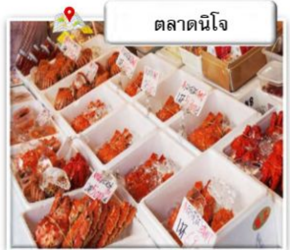
ตลาดนิโจ

ตลาดนิโจ มีประวัติศาสตร์ยาวนานกว่า 100 ปี เปรียบเสมือนห้องครัวของชาวเมืองซัปโปโรมาตั้งแต่สมัยก่อน นอกจากปลาแชลมอน ปู และหอยเชลล์ที่เป็นอาหารทะเลเด่น ๆ ของฮอกไกโดแล้ว ยังเต็มไปด้วยผลผลิตทางการเกษตรอย่างผลไม้และผักนานาชนิด นับเป็นตลาดที่ขาดไม่ได้สำหรับชาวเมืองซัปโปโรเลยทีเดียว ที่ตลาดนิโจในปัจจุบัน นอกจากจะมีร้านที่เปิดกิจการต่อเนื่องมาหลายสิบปี ก็ยังมีร้านที่เพิ่งเปิดใหม่ และบริเวณรอบ ๆ ก็มีร้านอิซากายะ (ร้านเหล้า) และร้านอาหารที่มีเอกลักษณ์เฉพาะตัวเพิ่มมากขึ้น ที่นี่จึงกลายเป็นสถานที่ท่องเที่ยวยอดนิยมที่สามารถมาทานอาหารทะเลสด ๆ ก็ได้ มาเลือกซื้อของฝากก็ได้