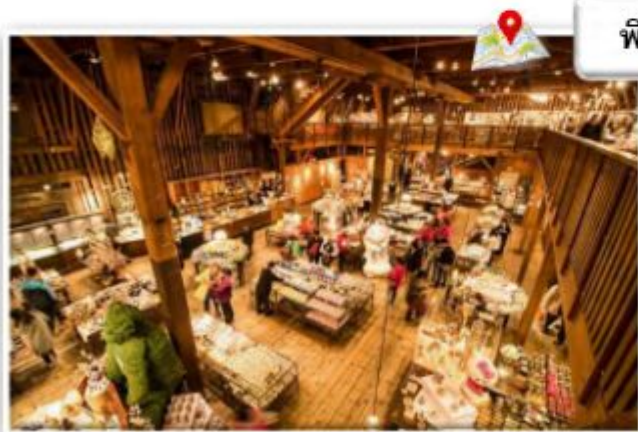
พิพิธภัณฑ์กล่องดนตรีโอตารุและหอนาฬิกาไอน้ำ

คลองโอตารุ (Otaru Canal) หรือในภาษาญี่ปุ่นเรียกว่า โอตารุอุงะ (Otaru Unga) เป็นคลองที่มีความสวยงามซึ่งไหลผ่านกลางเมืองโอตารุ เป็นแหล่งดึงดูดนักท่องเที่ยวที่สำคัญของเมืองในทุกฤดูกาล สามารถเดินเล่นริมคลองและมีบริการล่องเรือในคลองอีกด้วย ส่วนบริเวณริมคลองตกแต่งด้วยคอมไฟสไตล์วิคตอเรียนและมีอาคารโกดังที่สร้างจากอิฐเป็นแนวยาวไปตามคลอง ซึ่งในสมัยก่อนใช้เป็นโกดังสินค้าและในปัจจุบันได้กลายมาเป็นร้านอาหาร ทำให้ได้บรรยากาศโรแมนติกมาก ๆ ในช่วงเดือนกุมภาพันธ์ของทุกปียังใช้เป็นหนึ่งในสถานที่จัดงานเทศกาลหิมะช่วงหน้าหนาวซึ่งจะมีการประดับตกแต่งด้วยคอมไฟทั่วมือง