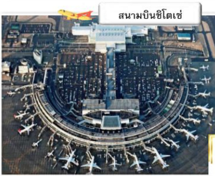
สนามบินชิตเซ่

เวลา 02.05 น. ออกเดินทางสู่ สนามบินชิตเซ่ ประเทศญี่ปุ่น โดยสายการบินไทยแอร์เอเชียเอ็กซ์ เที่ยวบินที่ XI 620