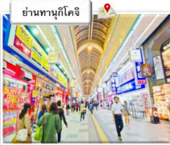
ย่านทานุกิโคจิ

ย่านทานุกิโคจิ (Tanuki Koji) ถือว่าเป็นย่านซุปป์ชื่อดังของเมืองซัปโปโร เป็นแหล่งซุปป์ในร่มที่มีหลังคาคลุมยาวตามแนวถนน ยาว 1 กิโลเมตร หรือประมาณ 7-8 บล็อก จนถึงแม่น้ำ Sosei ที่นี่เปิดมานานเป็นร้อยปี นับว่าเป็นตลาดเก่าแก่ที่เปิดตั้งแต่ปี ค.ศ. 1873 โดยสองข้างทางเต็มไปด้วยร้านค้ากว่า 200 ร้าน ทั้ง ร้านขายของที่ระลึก ขนม ของเล่น เครื่องสำอาง ซ็อคโกแลต เสื้อผ้า ข้าวของเครื่องใช้ต่าง ๆ และร้านอาหารให้เลือกรับประทานมากมาย