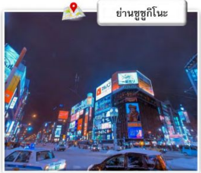
ย่านซูซุกิโนะ

ย่านซูซุกิโนะ เป็นย่านบันเทิงและย่านช้อปปิ้งที่ใหญ่ที่สุดในทางตอนเหนือของญี่ปุ่น เต็มไปด้วยร้านค้า บาร์ ร้านอาหาร ร้านคาราโอเกะ และตู้ปาจิงโกะ รวมกว่า 4,000 ร้าน ป้ายร้านค้าสว่างไสวยามค่ำคั่นจนถึงเที่ยงคืนเลยทีเดียว ในช่วงเดือนกุมภาพันธ์ ย่านซูซุกิโนะจะจัดเทศกาลหิมะ เป็นเจ้าภาพการแข่งขันแกะสลักน้ำแข็ง ประจำปีทุกปี จากนั้นเดินทางสู่ SAPPORO (ซัปโปโร) หนึ่งในเมืองหลักของเกาะ Hokkaido (ฮอกไกโด) เป็นเมืองหลักที่เป็นศูนย์กลางการท่องเที่ยวของเกาะ มีสถานที่ท่องเที่ยวหลากหลาย และเป็นศูนย์กลางในการเดินทางไปในหลาย ๆ สถานที่ของเกาะฮอกไกโด