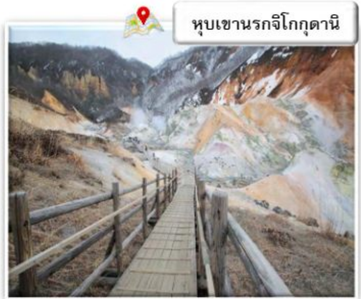
หุบเขานรกจิโกกุ다니

นำท่านสู่ หุบเขานรกจิโกกุ다니 JIGOKUDANI หรือ HELL VALLEY เป็นหุบเขาที่งดงาม น้ำร้อนในลาธารของหุบเขาแห่งนี้มีแร่ธาตุกำมะถันซึ่งเป็นแหล่งต้นน้ำของย่านบ่อน้ำร้อนโนโบริเบทสึนั่นเอง เส้นทางตามหุบเขาสามารถเดินไต่ขึ้นเนินไปเรื่อยๆ ประมาณ 20 - 30 นาทีจะพบกับบ่อโอยูนูมะ (OYUNUMA) เป็นบ่อน้ำร้อนกำมะถัน อุณหภูมิ 50 องศาเซลเซียส ถัดไปเรื่อยๆ ก็จะเป็นบ่อเล็ก ๆ บางบ่อมีอุณหภูมิที่ร้อนกว่า และยังมีบ่อโคลนอีกด้วย น้ำที่ไหลออกจาก บ่อโอยูนูมะ เป็นลำธารเรียกว่า โอยูนูมะกาวา (OYUNUMAGAWA) สามารถเพลิดเพลินไปกับทิวทัศน์ที่งดงาม