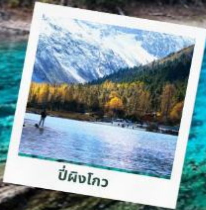
ป่ผิงโกว