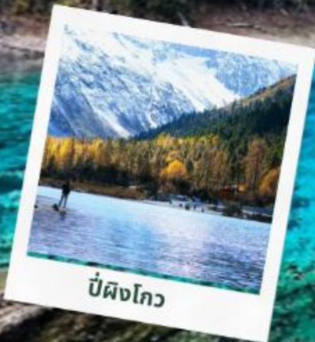
ป่ผิงโกว