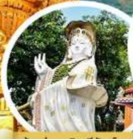
เจ้าแม่กวนอิม รัฟลีส เบย์