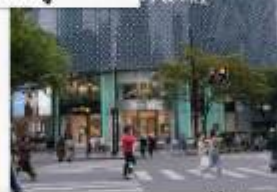
ถนนคนเดินหวยไห่