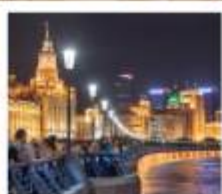
หาดว่อกาน