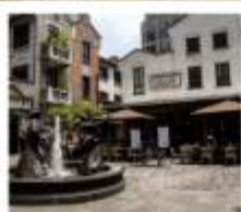
ซินเทียนตี้