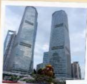
ย่านลู่เจียจู่ย