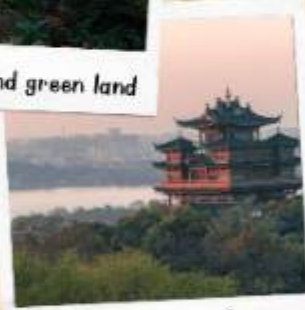
หอเจิ้งหวงเก้อ