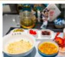
เชิตบะหมี่ราดซอสมันปู