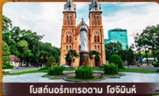
โบสถ์นอร์ทเทรอดาม โฮจิมินห์