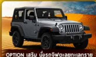
OPTION เสริม นั่งรถจี๊ปตะลุยทะเลทราย