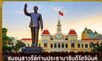
ชมอนุสาวรีย์ท่านประธานาธิบดีโฮจิมินห์