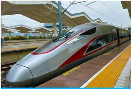
นวัตกรรมรถไฟความเร็วสูง