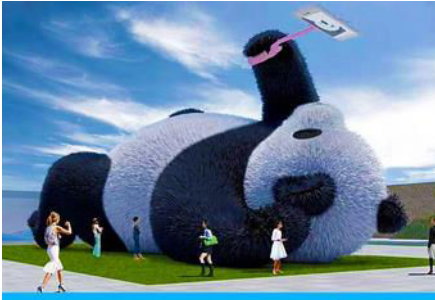
ตุ๊กตาแพนด้านอนเซลฟี

พักที่ MAOXIAN INTER HOTEL โรงแรมระดับ 4 ดาวหรือเทียบเท่าในเมืองเม่าเจียน