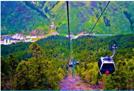
นั่งกระเช้าขึ้นสู่อุทยานหวงหลง

พักที่ JIUYUAN HOTEL ระดับ 4 ดาวท้องถิ่นหรือเทียบเท่าในอุทยานจิวจ้ายโกว