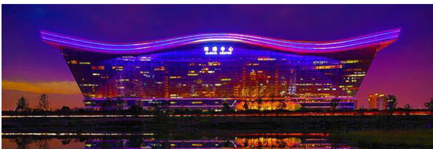
Chengdu new century global center

นำท่านเที่ยวชม ถนนโบราณ จิ้นลี่ 成都锦里古街 ถนนสายนี้มีความยาวราว 550 เมตร มีการออกแบบอาคารและตกแต่งสถานที่เลียนแบบบ้านเรือน โบราณยุคปลายราชวงศ์หมิงและต้นราชวงศ์ชิง ผนวกกับวัฒนธรรมยุคสามก๊ก เพื่อสะท้อนความเป็นเอกลักษณ์ของเมืองเฉิงตู ภายในมีจุดเช็คอินถ่ายภาพเก๋ ๆ และร้านกาแฟ ร้านอาหาร ร้านจำหน่ายของที่ระลึก โสมสเคย์มากมาย เป็นแหล่งท่องเที่ยวที่สะท้อนวัฒนธรรมของเมืองอย่างมีเอกลักษณ์ของเฉิงตู..