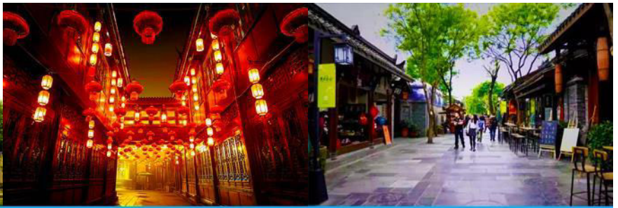
ถนนโบราณถนนจิ้นลี่