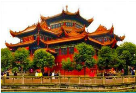
วัดเจาเจี๋ย