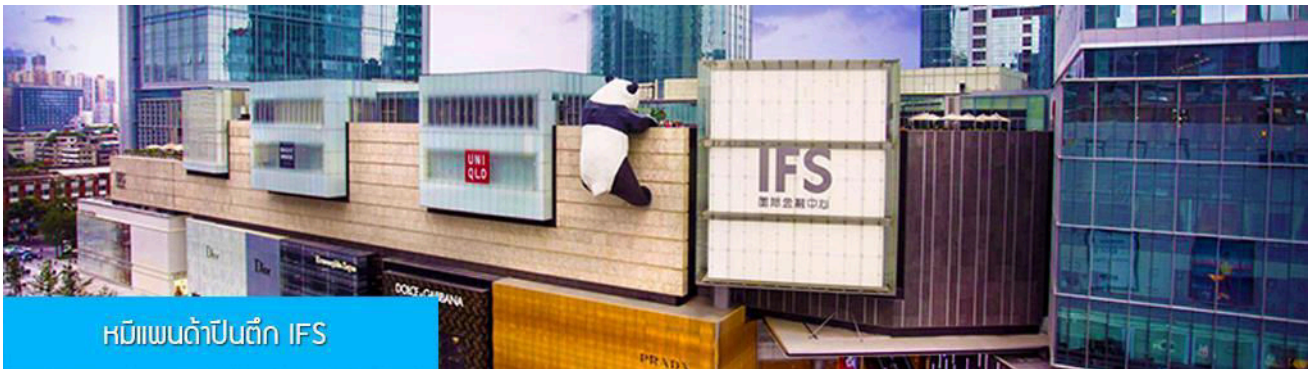
หมีแพนด้าปีนตึก IFS