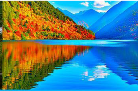
ทะเลสาบแพนด้า