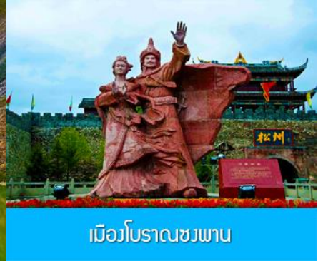
เมืองโบราณชวงพาน

วันที่ 1 เมืองชวงจู่ซือ – ทะเลสาบเต๋อซี-อุทยานภูเขาสี่ตระกูล-ผ่านชมวิภูเขารอบสูง