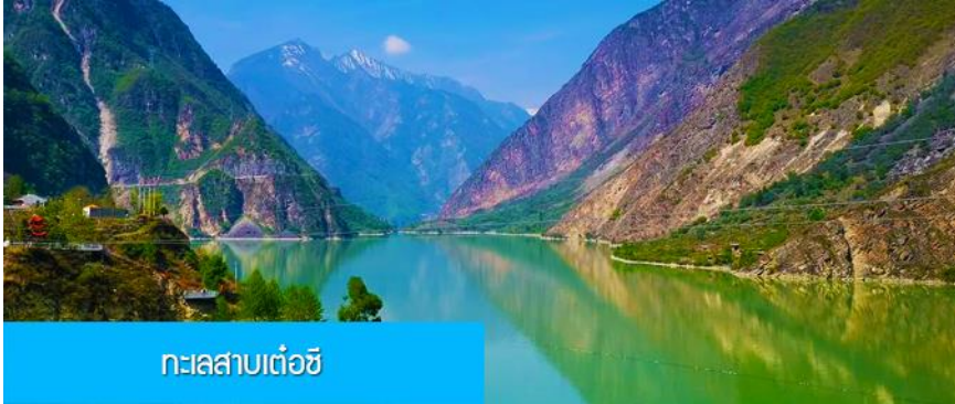
ทะเลสาบเต๋อซี

พักที่ MINJIANG HOTEL 5* หรือ โรงแรมระดับ 5 ดาวท้องถิ่น