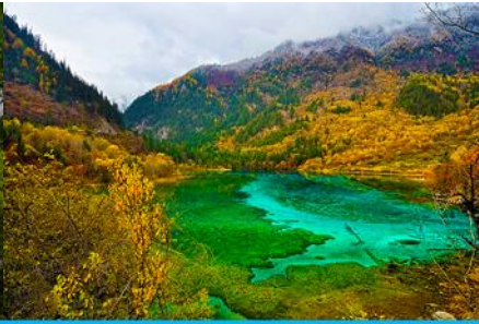
ทะเลสาบนกยูง (PEACOCK LAKE)