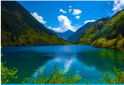
ทะเลสาบแรด (RHINO LAKE)