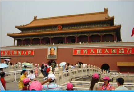
จัตุรัสเทียนอันเหมิน