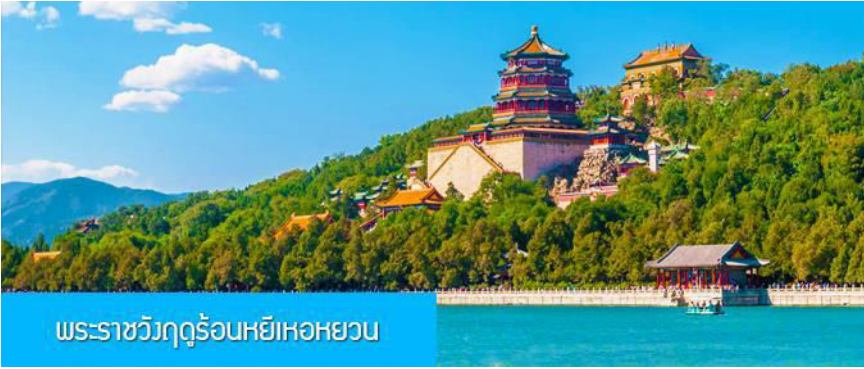
พระราชวังฤดูร้อนหยี่เหอหยวน