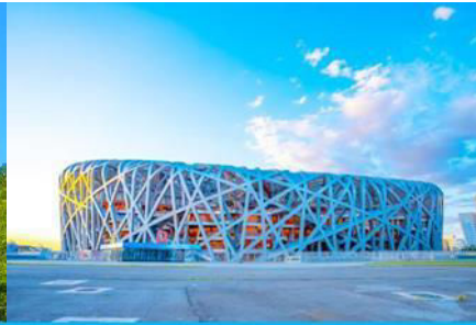
สนามกีฬาโอลิมปิก