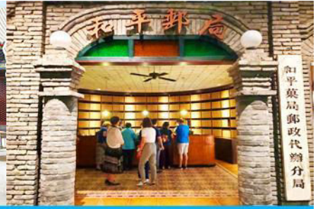
เมืองโบราณจำลอง