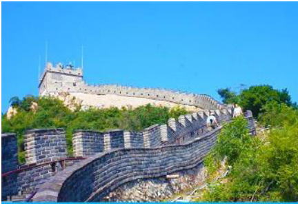
กำแพงเมืองจีนด่านจวิยงกวน

พักที่ HOLIDAY INN EXPRESS HTL OR ROYARD HTL 4* หรือโรงแรมในระดับเดียวกันในเมืองปักกิ่ง