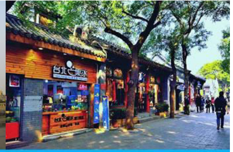
ซอยหนานหลัวกู่เซียง