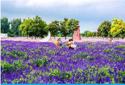
ทุ่งดอกลาเวนเดอร์