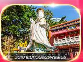
วัดเจ้าแม่กวนอิมพรหลัสเบย์