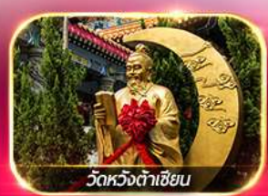
วัดหวงต้าเซียน